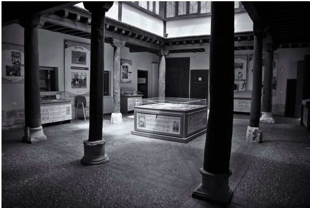
Patio central del CEINCE. Sala de exposiciones